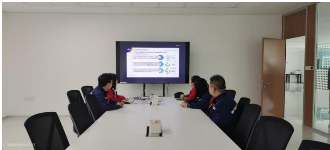
方圆辽宁公司助力辽宁省开展绿色产品认证培训活动。