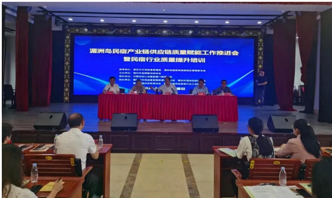
方圆厦门公司为众多企事业单位提供公益诊断服务，并开展公益培训活动，分享行业知识与经验，培养专业人才，推动行业整体发展。