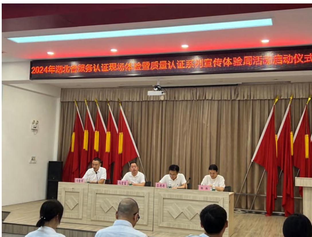
方圆湖北公司受邀参加 2024 年湖北省服务认证现场体验暨质量认证系列宣传体验周活动启动仪式。