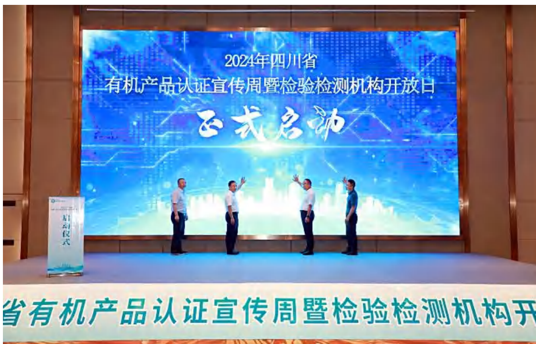
方圆四川公司受邀参加 2024 年四川省“有机产品认证宣传周暨检验检测机构开放日”活动。