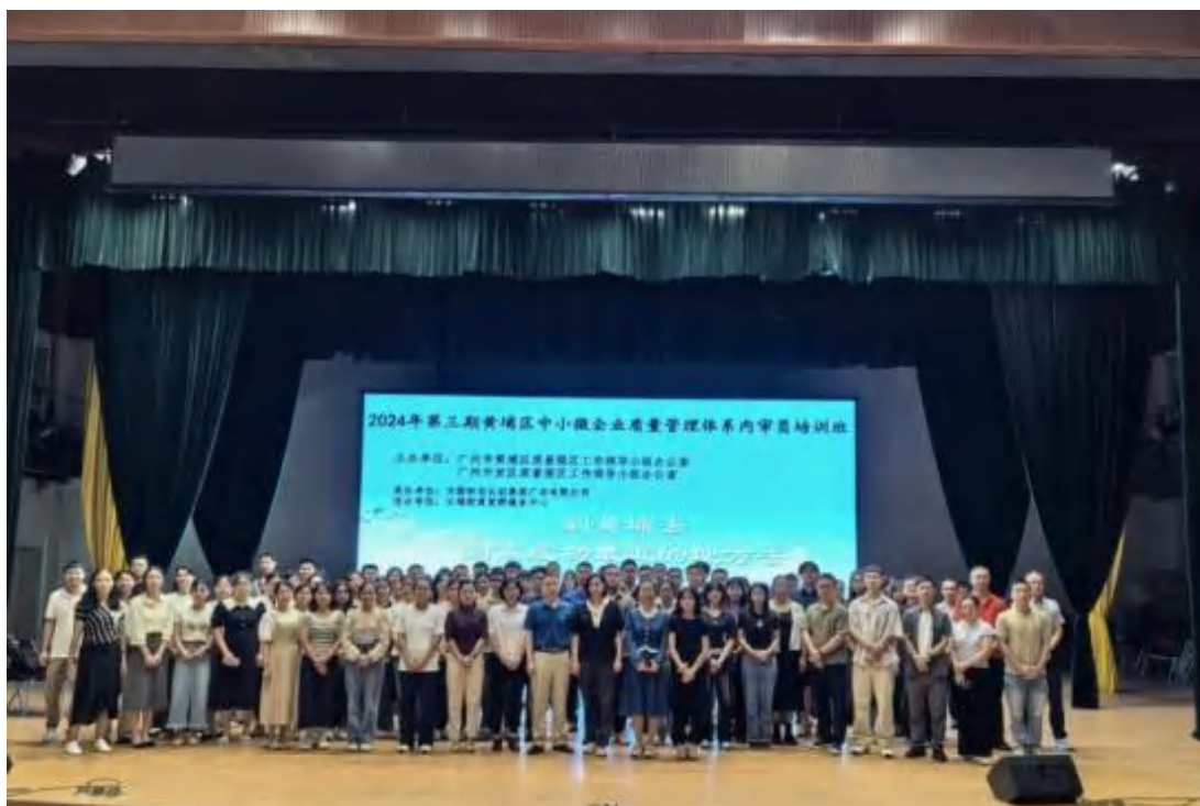
方圆广东公司多次开展企业质量管理能力提升、绿色低碳发展等培训活动。