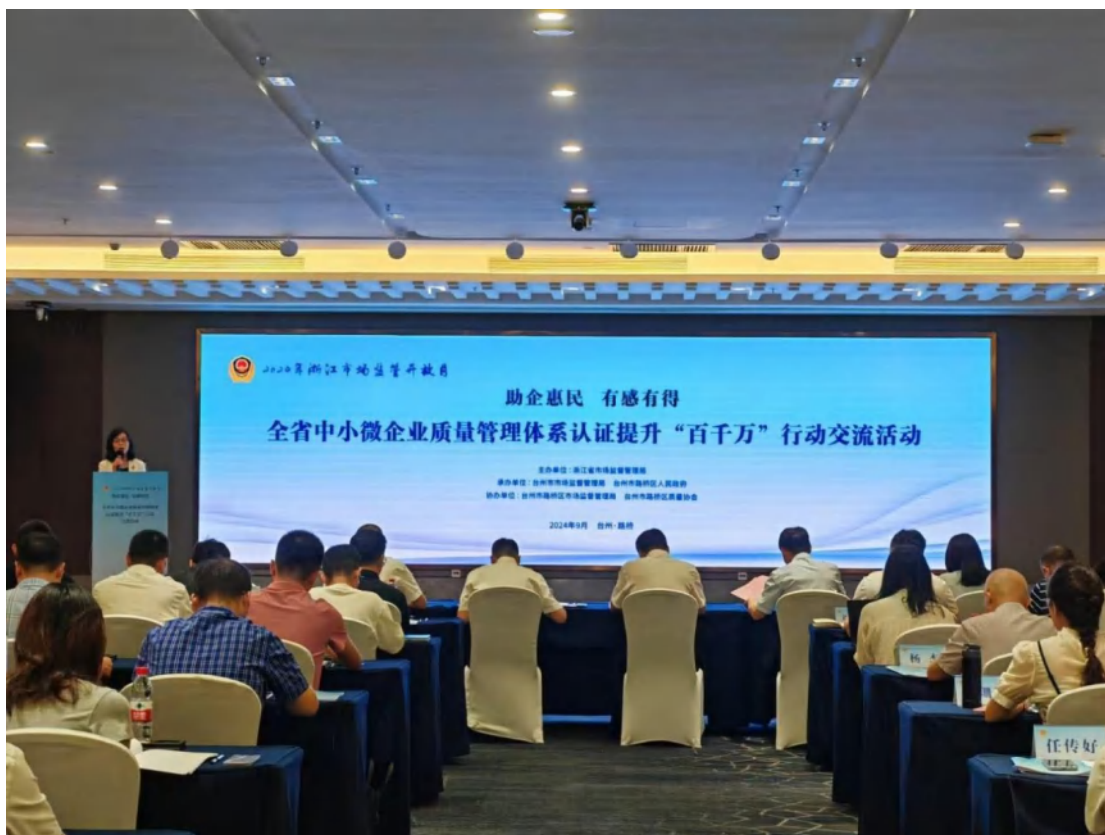
方圆浙江公司受邀参加浙江省中小企业质量管理体系认证提升“百千万”行动交流活动。