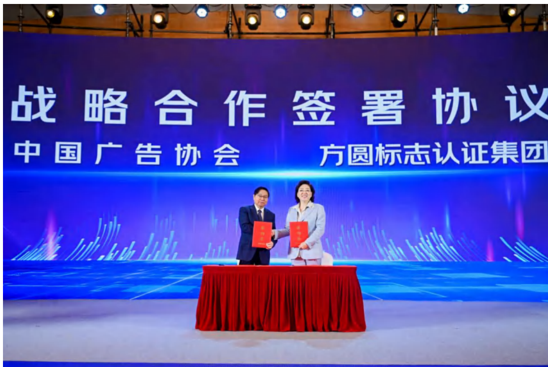
方圆集团与中国广告协会签署战略合作协议。