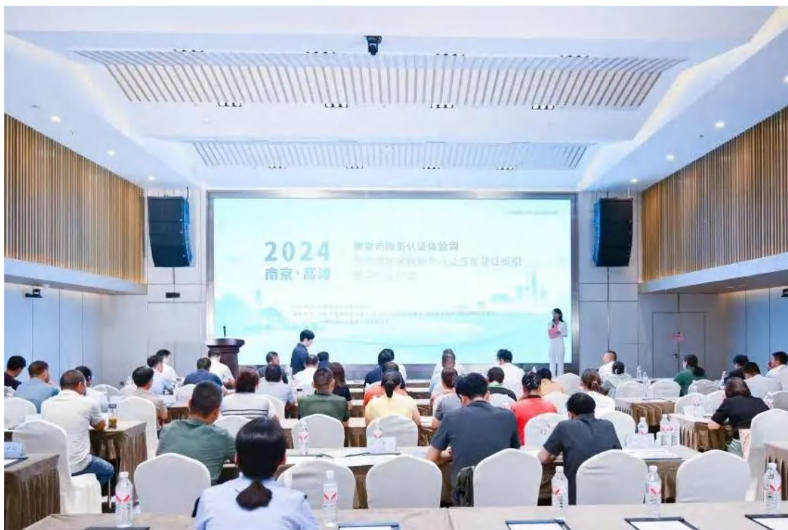
方圆江苏公司承办南京市服务认证体验周暨高淳区首批民宿服务认证集中颁证活动。