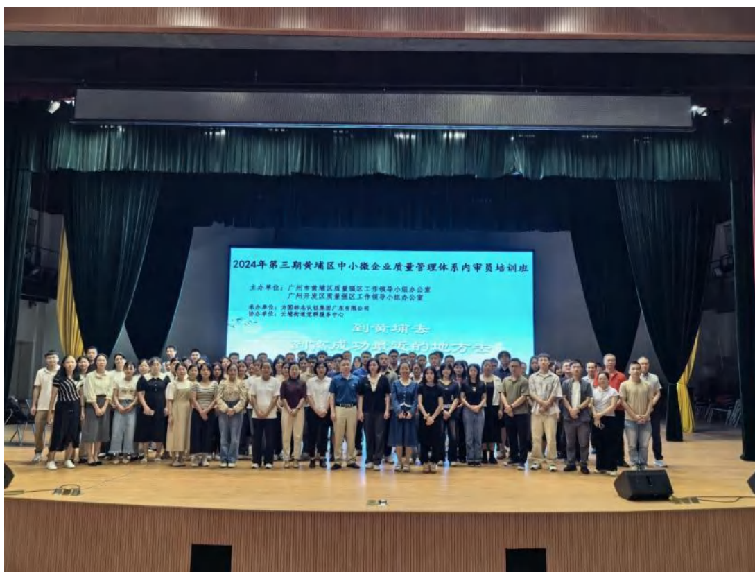
方圆广东公司助力广州市黄埔区 2024 年中小微企业质量管理体系内审员培