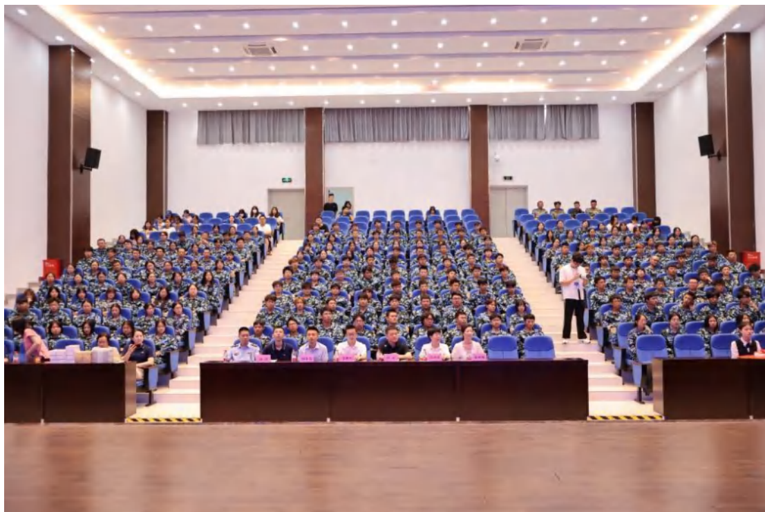
方圆福建公司协助福建省各级市场监管部门，在福建省各地承办、协办了 20 多场“质量月”系列活动，累计参与人员 1600 余人。