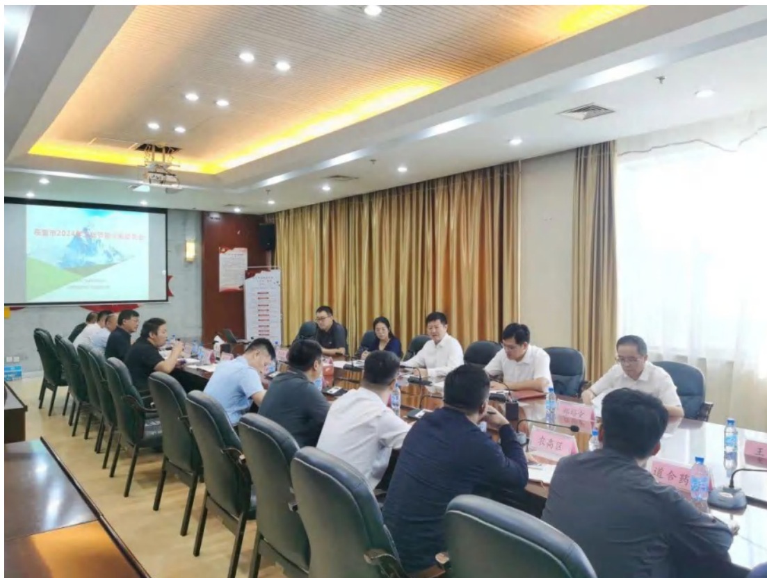
方圆山东公司为东营、泰安、聊城市 的 36 家单位开展公益性工业节能诊断服务。