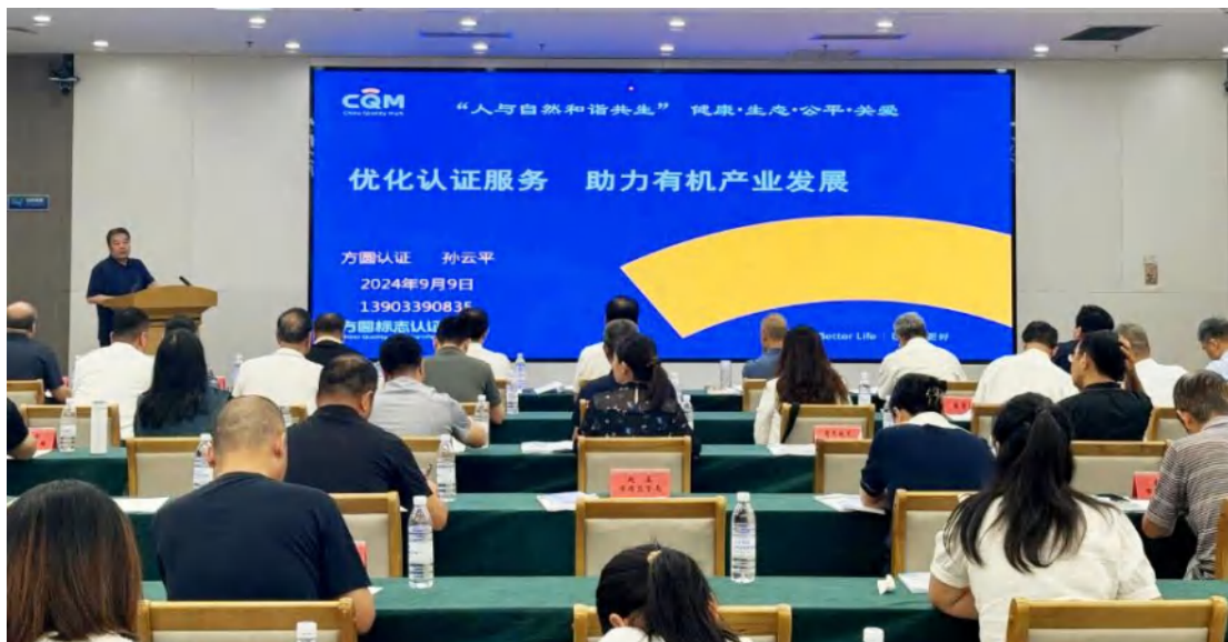
方圆河北公司受邀参加河北省全省质量认证系列宣传体验周启动仪式暨石家庄市有机产品认证宣传展示活动。