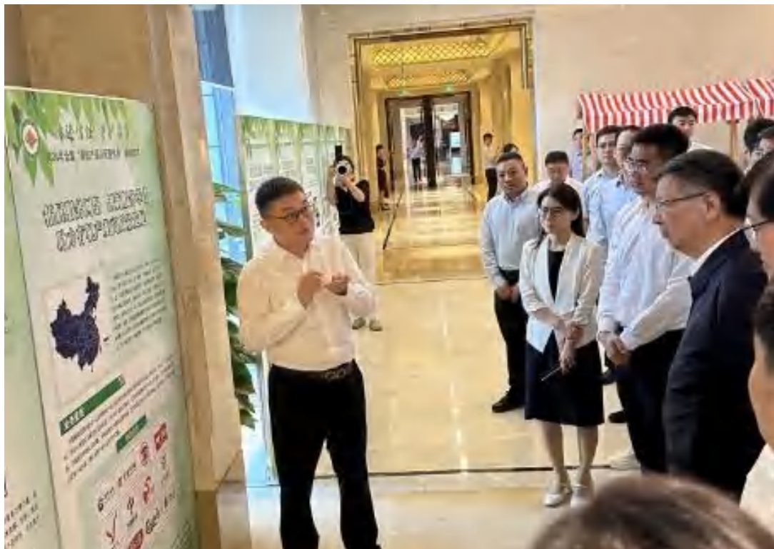
方圆农食江苏公司受邀参加 2024 年全国“有机产品认证宣传周”启动仪式。