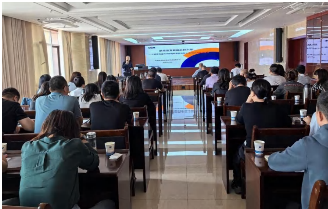
方圆甘肃公司在甘肃兰州、天水、临夏，宁夏银川、中宁，青海西宁等地开展技能培训和技術帮扶提升活动。