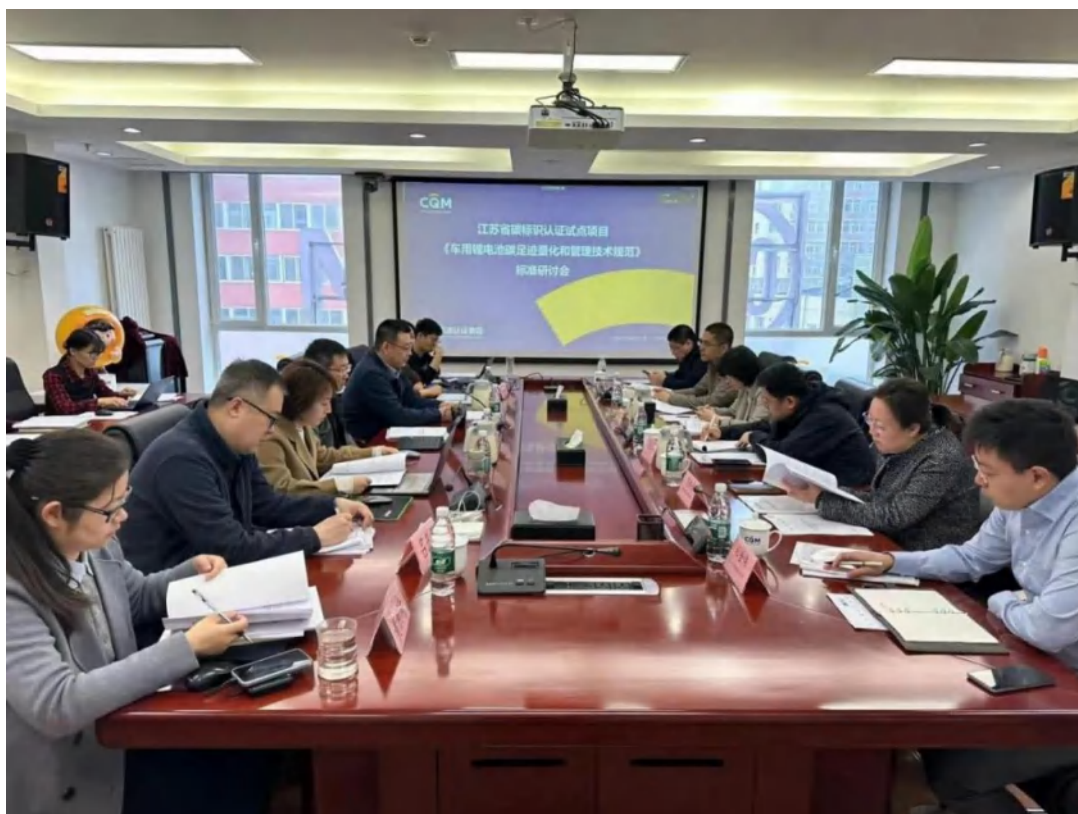
方圆集团作为江苏省动力电池产业链碳足迹标识认证试点项目的申报单位，