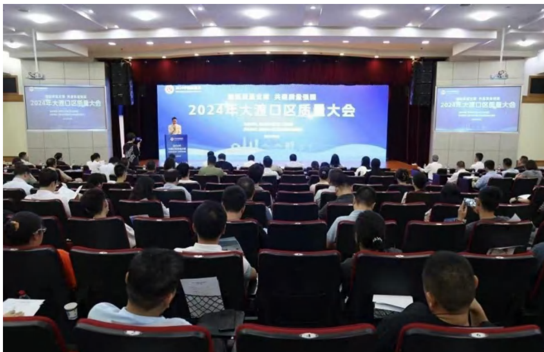
方圆重庆公司受邀参加重庆市大渡口区质量月活动。