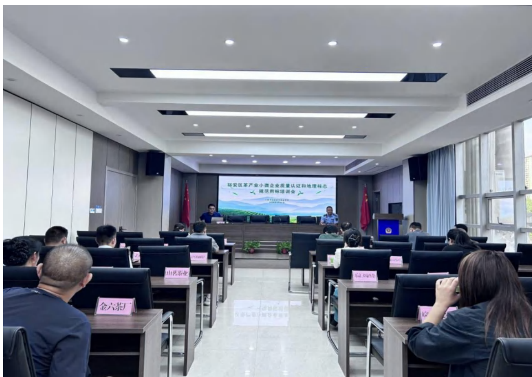
方圆安徽公司受邀为六安市裕安区茶企做有机产品认证专题培训。