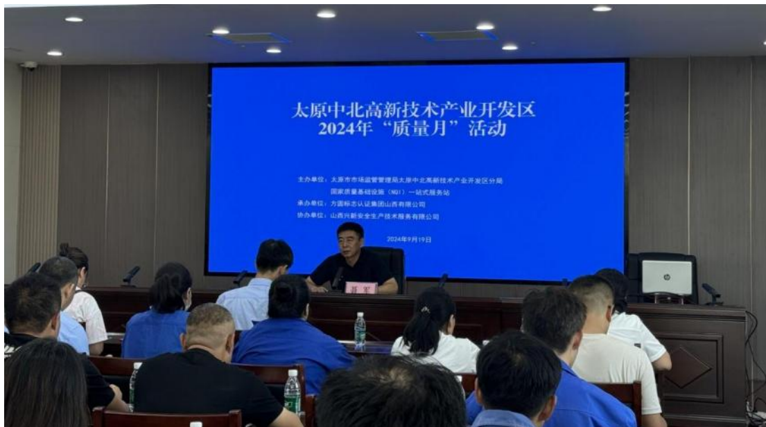
方圆山西公司受邀参加太原中北高新技术产业开发区“质量月”活动。