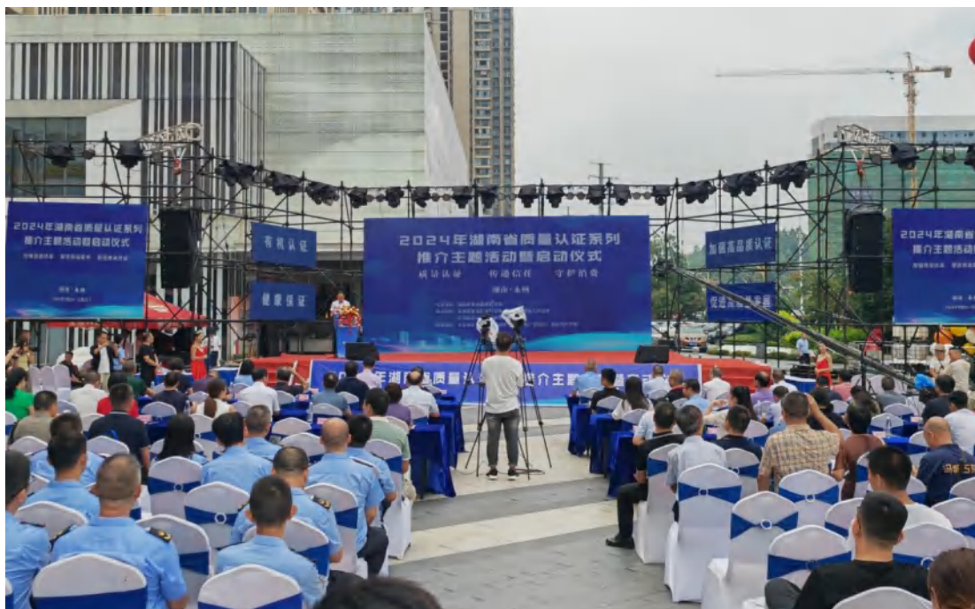
方圆湖南公司助力 2024 年湖南省质量认证系列推介主题活动暨启动仪式成功举办。