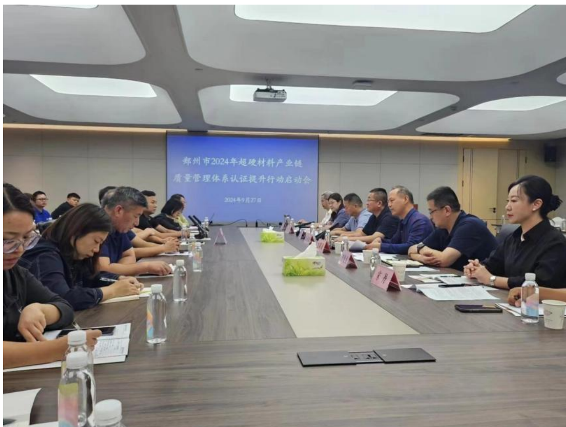
方圆河南公司助力郑州市市场监管局“质量月”活动暨超硬材料产业链质量提升启动会。