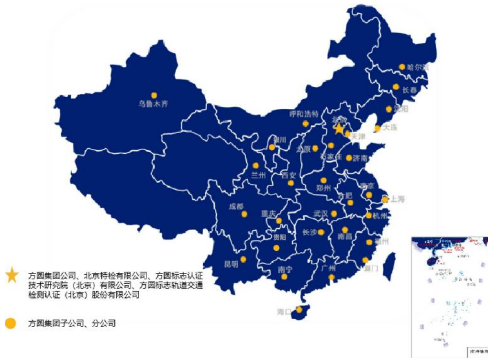
方圆标志认证集团分支机构分布图

CQM 方圆以认证为基础, 通过专业可靠的服务为各行业的高质量发展提供一体化解决方案, 推动全球生活品质的不断创新, 让每一个人都能享受更美好的未来。CQM 方圆将秉承“用信任连接美好未来”的品牌愿景, 持续发扬“专业、可靠、创新、国际化”的品牌精神, 在技术和人之间, 搭建信任的桥梁, 让消费者“简单信任, 放心选择”!