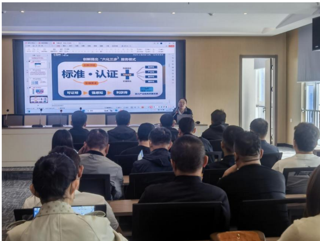
方圆新疆公司助力伊犁市场监管局开展“质量月”活动。