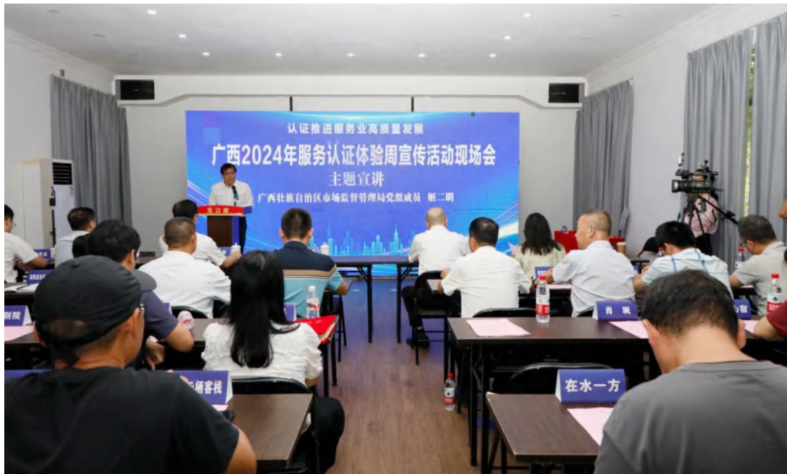
方圆广西公司积极参与广西 2024 年服务认证体验周宣传活动。