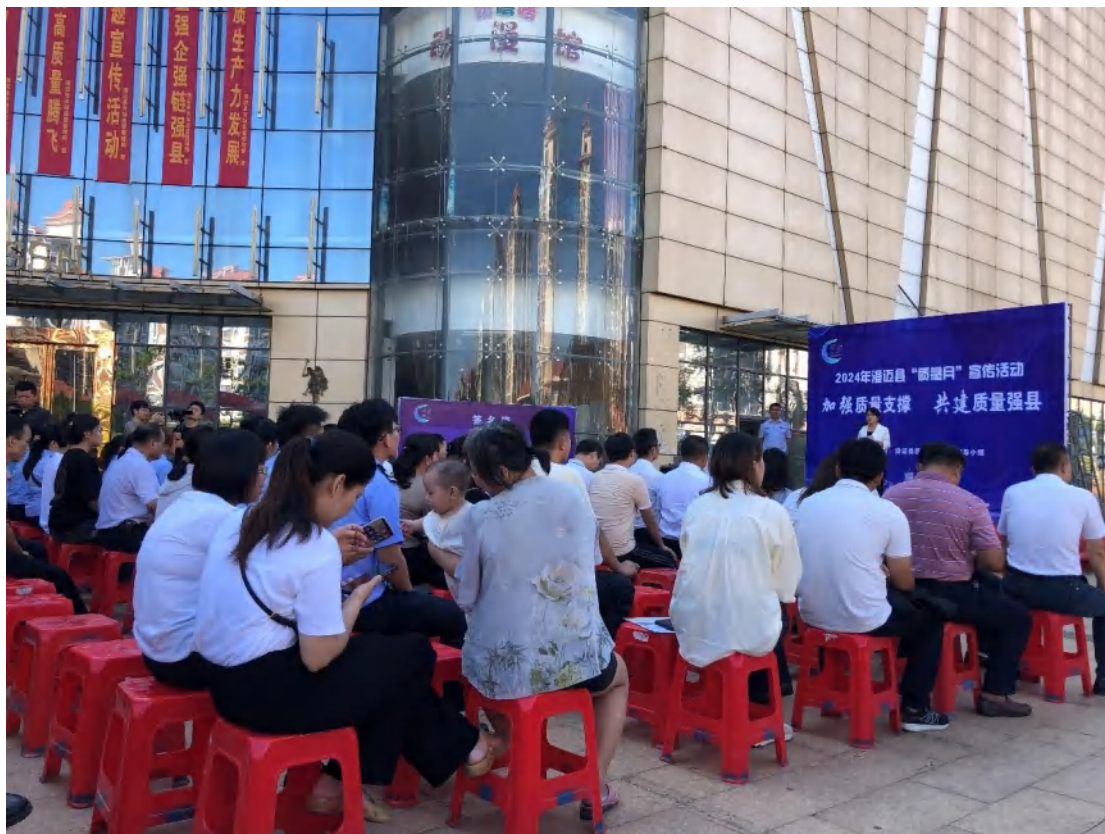
方圆海南公司受邀参加海南省澄迈县 2024 年“质量月”宣传活动。