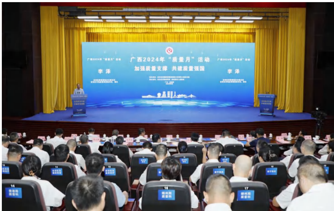
方圆广西公司受邀参加广西 2024 年“质量月”活动。